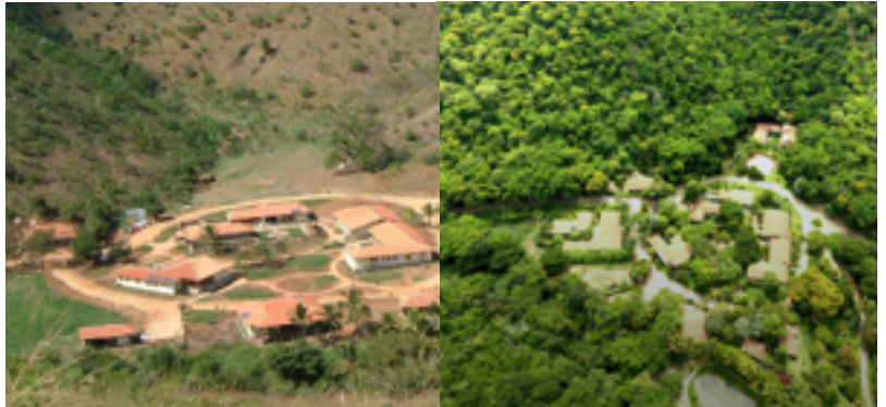
Instituto Terra: 2001 (links) vs 2019 (rechts)

Een mooi voorbeeld hiervan is Instituto Terra in Brazilië. In dit burgerinitiatief is in 20 jaar tijd een droog-zanderig gebied samen met de lokale gemeenschap en verschillende partners volledig hersteld. Het laat zien dat het mogelijk is voor mensen om de natuur te helpen, en opnieuw vanuit de kern en kracht van de aarde een vruchtbaar landschap op te bouwen.