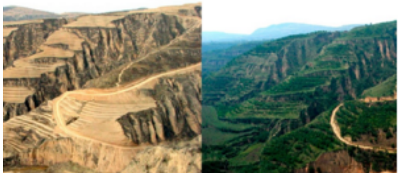
Löss-plateau: 1995 (links) vs 2009 (rechts)

Het löss-plateau in China, een gebied zo groot als België is ook een voorbeeld van de kracht van natuurherstel. Overlast van grote hoeveelheden löss (zand) in lucht en water op kilometers afstand van het plateau was de aanleiding van de Chinese overheid voor een grootschalig natuurherstelproject. In een samenwerking tussen overheid